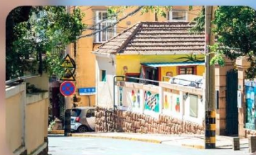
ถนนหลงเจียง