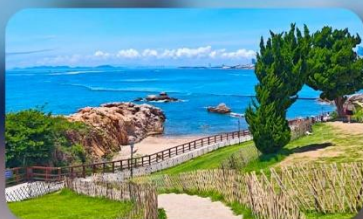
เกาะสี่เหลี่ยมเต่า