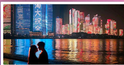
ชายหาดหมายเลข 3