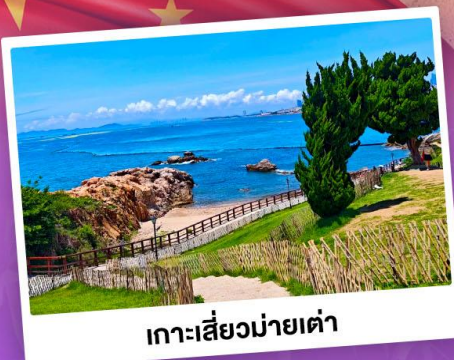
เกาะเสี่ยวมายเต่า

เที่ยวชิงเต่า เมืองทะเลสุดชิล ครบทั้งกิน เที่ยว ถ่ายรูป