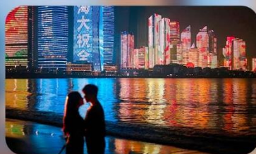
ชายหาดหมายเลข 3