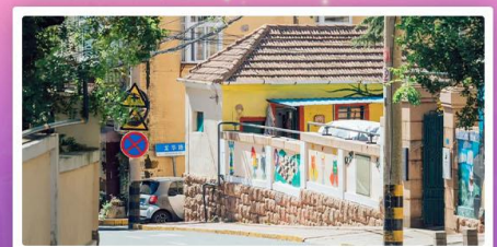
ถนนหลงเจียง