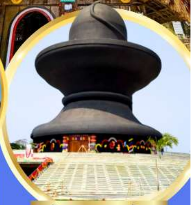
วันมหาฤตยูชัย