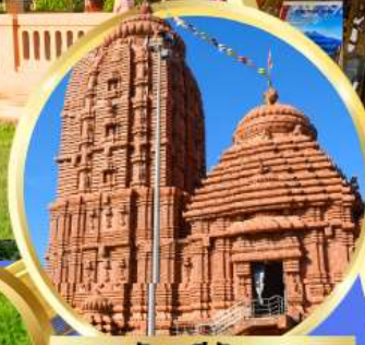
เทวาลัยศรีจักรนารท แห่งดีบุรกาห์