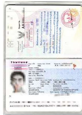
Passport เต็ม 2 หน้า