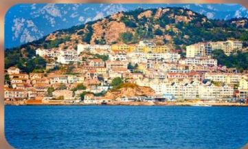
หมู่บ้านชาวประมงชาจื่อโจว