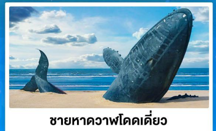
ชายหาดวาฬโดดเคี้ยว