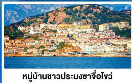
หมู่บ้านชาวประมงซาจี้โจว