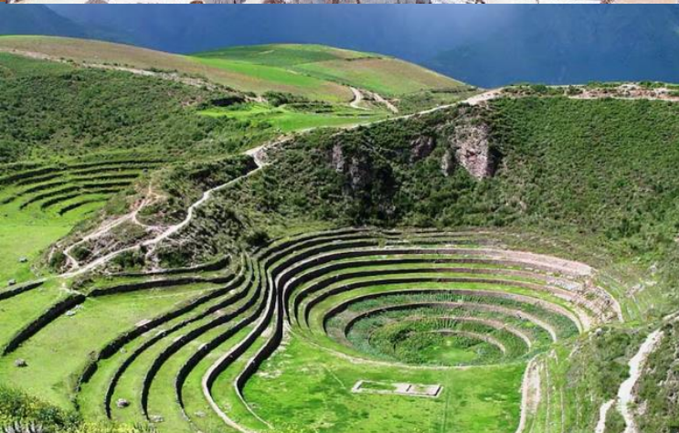
บ่าย นำท่านเดินทางสู่ มาราซ (Maras) แหล่งผลิตเกลือที่คุณภาพดีที่สุดในโลก ที่มีมาตั้งแต่สมัยอินคา แนวนาขั้นบันไดที่เรียงอยู่ตามลำดับความสูงของภูเขา จากนั้นเดินทางสู่ โมเรย์ (Moray) นาขั้นบันไดวงกลมขนาดใหญ่หลายรูปร่างแปลกตาที่ชาวอินคาทำไว้เพื่อทดลองปลูกพืชพันธุ์ต่างๆ จากจุดนี้สามารถมองเห็น หมู่บ้านอูรัมบัмба (Urubamba) ได้อีกด้วย ได้เวลาเดินทางกลับสู่เมือง เมืองคัสโก (Cusco) เมืองหลวงของอาณาจักรอินคา ที่แพร่ขยายอำนาจจนกินพื้นที่ 1 ใน 3 ของอเมริกาใต้ ตั้งอยู่เหนือระดับน้ำทะเลถึง 3,400 เมตร และเป็นแหล่งอารยธรรมยุคก่อนประวัติศาสตร์ที่ลึกลับน่าทึ่ง เป็นชุมชนเก่าแก่ของจักรวรรดิอินคาอันรุ่งเรือง ซึ่งยังคงทิ้งร่องรอยความเจริญไว้ให้เห็นเป็นซากปรักหักพังโบราณและโบราณวัตถุต่างๆ