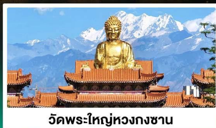
วัดพระใหญ่ทวงกงซาน