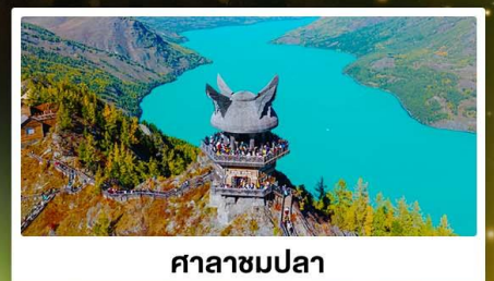
ศาลาชมปลา