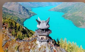
ศาลาชมปลา