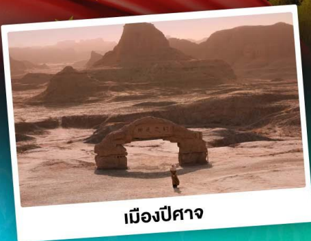
เมืองปีศาจ

Autumn in Kanas ผืนป่าเบิร์ชเปลี่ยนสีพร้อมกันทั้งหุบเขา