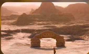
เมืองปีศาจ