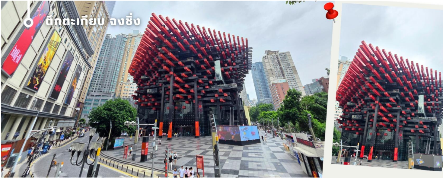
ตึกตะเกียบ จงชิ่ง

เอกลักษณ์ อาคารนี้ถูกวางโครงสร้างให้มีรูปร่างคล้ายกอง "ตะเกียบยักษ์" สีดำและแดงที่วางซ้อนกันเป็นชั้นๆ ที่ส่วนปลายของตะเกียบสีแดงจะมีตัวอักษรจีนคำว่า "กั่ว" ประทับอยู่ ซึ่งมีความหมายถึง ชาติหรือประเทศ ส่วนที่ปลายตะเกียบสีดำ จะมีอักษรจีนคำว่า "ไท่" ประทับอยู่ ซึ่งหมายถึง ความเงียบสงบ หรือความอุดมสมบูรณ์