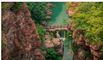
อุทยานสวรรค์หยุนโกซาน