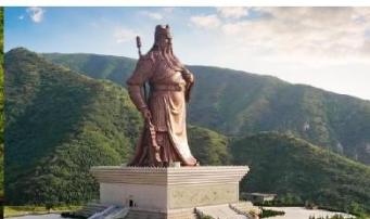
บ้านเกิดท่านกวนอู