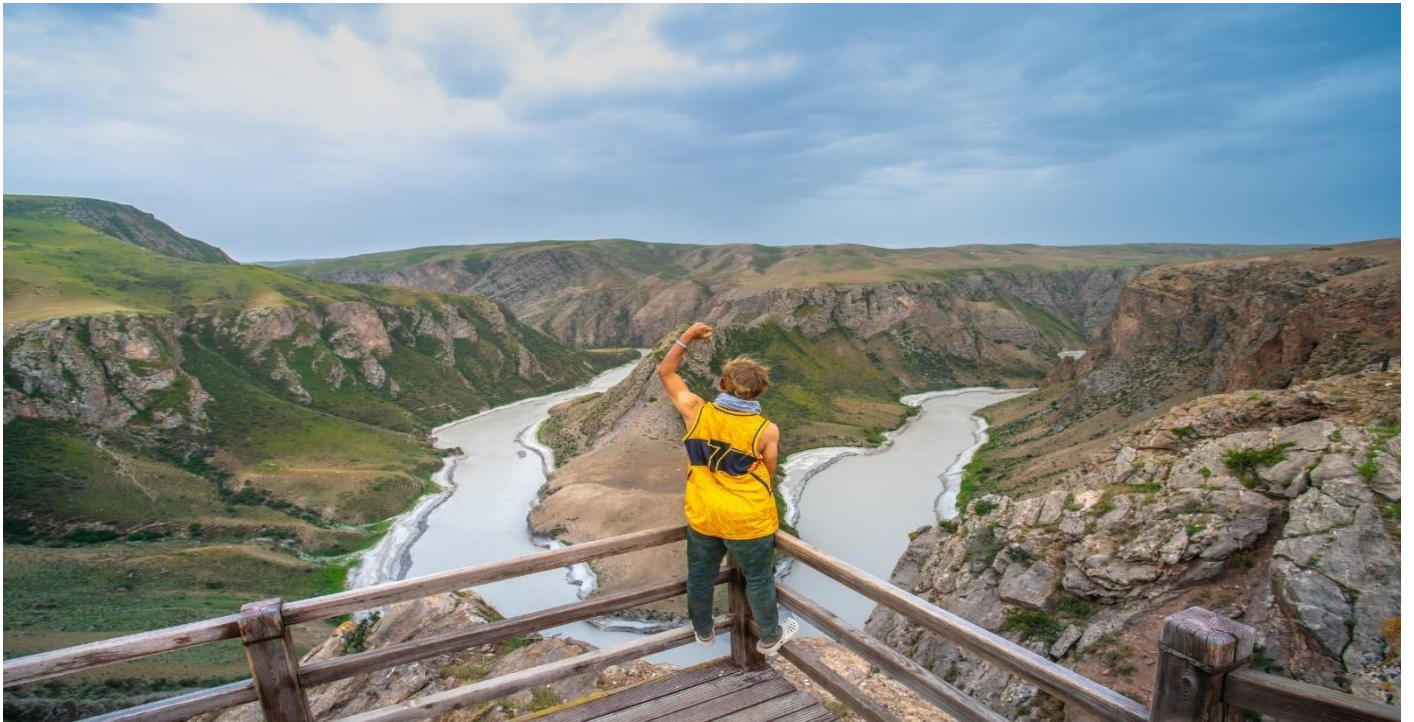
ผลงานชิ้นเอกของธรรมชาติที่หาชมได้ยาก กลางวัน |📍| รับประทานอาหารกลางวัน ณ ภัตตาคาร

นำท่านเดินทางออกจากเมืองเท่อเค่อซือ มุ่งหน้าสู่ แกรนด์แคนยอนคั่วเค่อซู (Kuokesu Grand Canyon) ซึ่งตั้งอยู่ในอาณาบริเวณของอุทยานกาลาจุน แคนยอนแห่งนี้เกิดจากการกัดเซาะของแม่น้ำคั่วเค่อซูที่ไหลผ่านชั้นหินปูนเป็นเวลาหลายล้านปี จนเกิดเป็นหน้าผาสูงชันและหุบเขาลึกที่ดัดเคี้ยว ไฮไลท์สำคัญคือการชม "อ่าวจระเข้" (Crocodile Bay) โคน้ำที่มีลักษณะเกาะแก่งคล้ายจระเข้ตัวใหญ่มากำลังหมอบอยู่กลางแม่น้ำสีเขียวมรกต รวมถึงทัศนียภาพของ "ทุ่งหญ้าสรีระ" (Human Body Grassland) เนินดินที่โค้งเว้าสลักรับซัดซ้อนราวกับสัดส่วนของมนุษย์ยามแสงและเงาตกกระทบ ถือเป็น