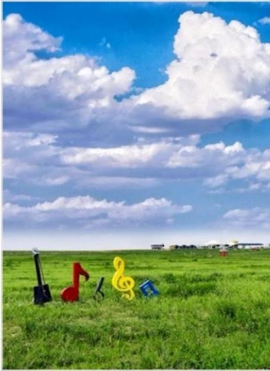
ทุ่งหญ้าออร์ดอส (Ordos Prairie)