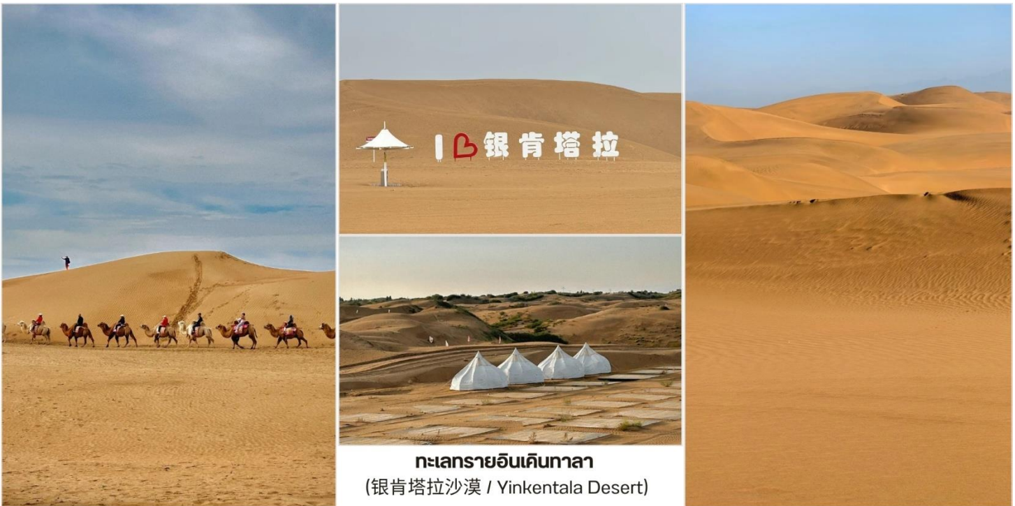
ทะเลทรายอินเคินทาลา (银肯塔拉沙漠 / Yinkentala Desert)

บ่าย นำท่านชม ทะเลทรายอินเคินทาลา (银肯塔拉沙漠 / Yinkentala Desert) ซึ่งเป็นส่วนหนึ่งของทะเลทรายคูบูฉี (Kubuqi) ในมองโกเลียใน สถานที่นี้เป็นไฮไลท์เด็ดสำหรับสายกิจกรรมและคนที่ชอบภาพถ่ายแนวอลังการ แหล่งท่องเที่ยวระดับ 4A ของจีน เดินทอดน่องบนสันทรายที่ละเอียดยุ่มดุกดำมะหยี่ ถ่ายรูปท่ามกลาง