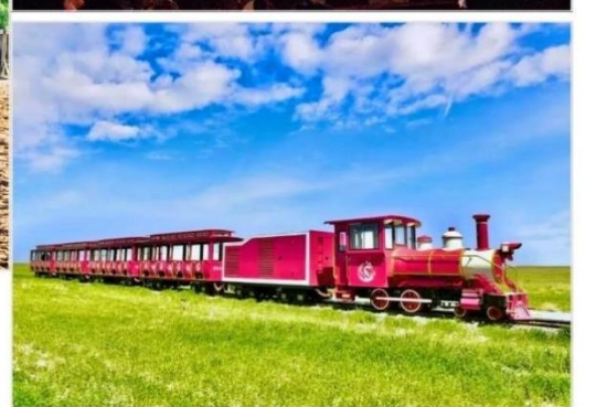
OPTION TOUR.. กิจกรรมทุ่งหญ้าออร์ดอส (Ordos Prairie)