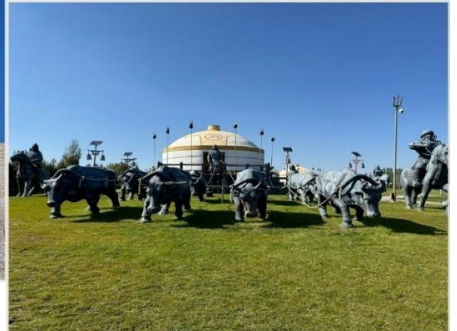
เขตท่องเที่ยวเจงกิสข่าน • กลุ่มประติมากรรม กองทัพเหล็กและกระโจมทอง

จากนั้นนำท่านตามรอยเท้าของมหาบุรุษผู้ยิ่งใหญ่ "เจงกิสข่าน" (Genghis Khan) นำท่านชม เขตท่องเที่ยวเจงกิสข่าน (Genghis Khan Tourist Area, 成吉思汗旅游区) ซึ่งเป็นสถานที่สำคัญทางประวัติศาสตร์และวัฒนธรรมที่ตั้งอยู่ในเมืองเอ้อเอ๋อร์ตัวซือ (Ordos) เขตปกครองตนเองมองโกเลียในประเทศจีน ที่นี้ไม่เพียงเป็นสถานที่รำลึกถึงเจงกิสข่าน แต่ยังเป็นศูนย์รวมประสบการณ์ที่จะพาคุณย้อนเวลากลับไปสู่ยุครุ่งเรืองของชนเผ่า