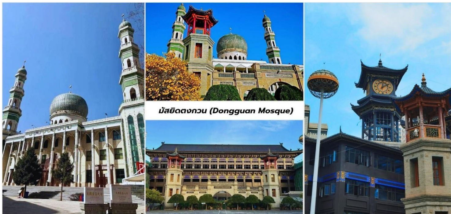
มัสยิดตงกวน (Dongguan Mosque)

จากนั้นนำท่านเที่ยวชมด้านนอก มัสยิดตงกวน (Dongguan Mosque) เป็นหนึ่งในมัสยิดที่ใหญ่และสำคัญที่สุดในประเทศจีน มีประวัติศาสตร์ยาวนานกว่า 600 ปีและเป็นศูนย์กลางของชุมชนมุสลิมในภูมิภาคนี้ โครงสร้างของมัสยิดสะท้อนถึงการผสมผสานระหว่างสถาปัตยกรรมจีนดั้งเดิมและสไตล์อิสลาม มัสยิดตงกวนมีความสำคัญต่อชุมชนมุสลิมในซีหนิงเป็นอย่างมาก เป็นศูนย์กลางทางศาสนาและวัฒนธรรม นอกจากนี้มัสยิดแห่งนี้ยังเป็นสัญลักษณ์ของความหลากหลายทางวัฒนธรรมในประเทศจีนและเป็นตัวอย่างของการอยู่ร่วมกันอย่างสันติสุขระหว่างชาวมุสลิมและชาวพุทธ