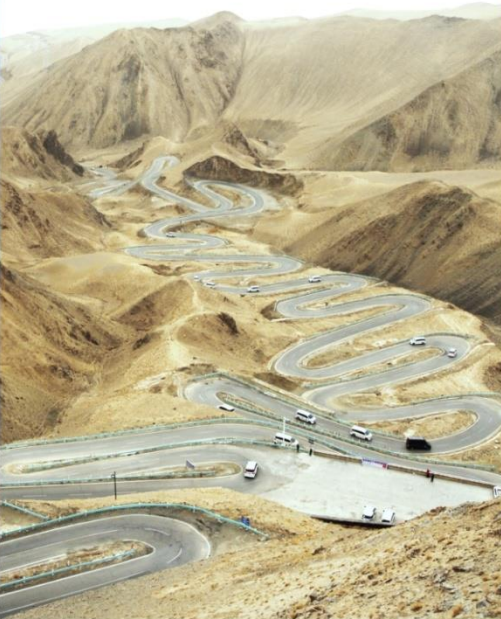
ถนนมังกรพันโค้ง/ผานหลง (Panlong Ancient Road)