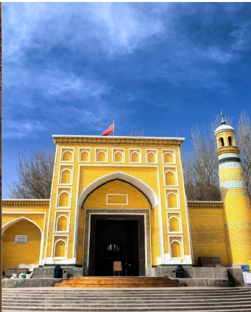
มัสยิดอิตก้าห์ (Id Kah Mosque)