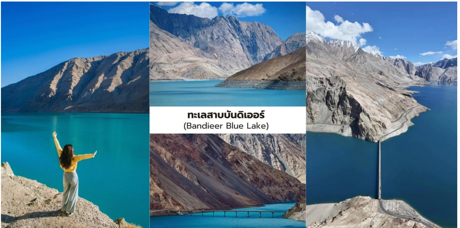
ทะเลสาบบันด์เอร์ (Bandieer Blue Lake)

นำท่านเที่ยวชม ทะเลสาบบันด์เอร์ (Bandieer Blue Lake) ทะเลสาบสีฟ้าใสที่ตั้งอยู่บน ที่ราบสูงปามิร์ เกิดจากน้ำละลายของธารน้ำแข็งโบราณทำให้พื้นน้ำมีสีฟ้าครามเข้มตัดกับภูเขาหินสีน้ำตาลที่โอบล้อมอยู่โดยรอบ เกิดเป็นทัศนียภาพที่งดงามและแปลกตา พื้นน้ำของทะเลสาบสามารถเปลี่ยนเฉดสีตามแสงและสภาพอากาศบางช่วงจะปรากฏเป็น สีเขียวมรกต และบางช่วงเป็น สีน้ำเงินครามลึก สะท้อนเงาของภูเขาและท้องฟ้าอย่างสวยงามทำให้ทะเลสาบแห่งนี้ถูกขนานนามว่าเป็น “อัญมณีแห่งที่ราบสูงปามิร์” บริเวณโดยรอบยังคงความเงียบสงบและธรรมชาติที่บริสุทธิ์เหมาะสำหรับการชมวิวและถ่ายภาพถือเป็นหนึ่งใน จุดชมวิวธรรมชาติที่สวยงาม และยังไม่เป็นที่รู้จักมากนักของจีนเจียง ซึ่งนักท่องเที่ยวทั่วไปยังเดินทางมาไม่ถึงมากนัก