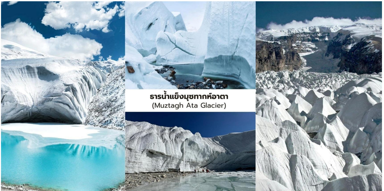
ธารน้ำแข็งมุชทากห้อตา (Muztagh Ata Glacier)

จากนั้นนำท่านเดินทางต่อสู่ เมืองทาชเคอร์กาน (Tashkurgan) ระยะทางจากมุชทากห้อตาประมาณ 50 กิโลเมตร ใช้เวลาเดินทางราว 1 ชั่วโมง อำเภอทาชเคอร์กานเป็นเมืองชายแดนที่ตั้งอยู่บนความสูงประมาณ 3,000 กว่าเมตรเหนือระดับน้ำทะเล ซึ่งเป็นเขตปกครองตนเองของชนเผ่าทาจิกและมีชาวทาจิกอาศัยอยู่เป็นประชากรส่วนใหญ่ของพื้นที่เมืองแห่งนี้ ด้วยความที่ตั้งอยู่ใกล้ชายแดนปากีสถาน ทาจิกิสถานและอัฟกานิสถานทำให้มีความสำคัญทั้งในด้านภูมิศาสตร์และวัฒนธรรมในอดีตพื้นที่แห่งนี้เคยเป็น จุดยุทธศาสตร์สำคัญบนเส้นทางสายไหม (Silk Road) ซึ่งใช้เป็นเส้นทางผ่านของพ่อค้าและนักเดินทางระหว่างจีนกับเอเชียกลาง ปัจจุบันแม้จะเป็นเมืองที่มีขนาดเล็ก แต่ก็ยังคงรักษาวัฒนธรรม วิถีชีวิตและเอกลักษณ์ของชนเผ่าทาจิกท่ามกลางภูมิประเทศของที่ราบสูงปามีร์ที่งดงามและเจียบสงบ เมืองทาชเคอร์กานจึงถือเป็นหนึ่งในเมืองชายแดนที่มีเอกลักษณ์ทางชาติพันธุ์และประวัติศาสตร์บนเส้นทางสายไหมที่สะท้อนถึงการผสมผสานของวัฒนธรรมจีนและเอเชียกลางได้อย่างน่าสนใจ.