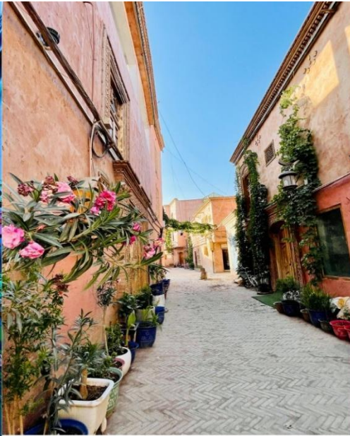
ถนนสายรุ้ง (Rainbow Alley)