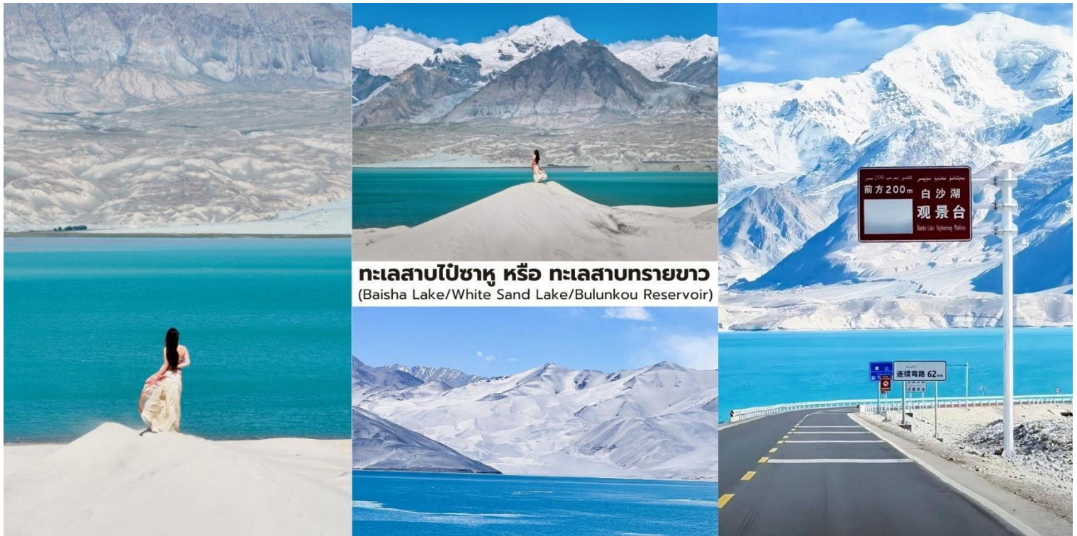
ทะเลสาบไปซาหู หรือ ทะเลสาบทรายขาว (Baisha Lake/White Sand Lake/Bulunkou Reservoir)

จากนั้นนำท่านเดินทางกลับสู่ เมืองคัชการ์ ระยะทางประมาณ 200 กิโลเมตร ใช้เวลาเดินทางราว 3.5 – 4 ชั่วโมง