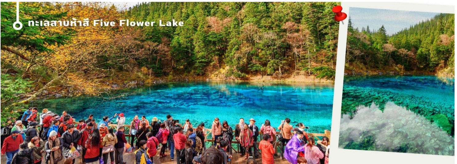
ทะเลสาบห้าสี Five Flower Lake

ทะเลสาบที่ใหญ่ที่สุด สูงที่สุด และลึกที่สุดในจิวจ้ายโกว ด้วยเนื้อที่กว่า 581 ไร่ ความยาวกว่า 7 กิโลเมตร และลึกถึง 103 เมตร ทอดตัวโค้งเป็นรูปพระจันทร์เสี้ยว เนื่องจากหิมะบนภูเขาละลายลงมา น้ำในทะเลสาบสีฟ้าสวยงาม ล้อมรอบด้วยยอดเขาสูงชัน และต้นไม้ใหญ่ที่ปกคลุมด้วยหิมะ งดงามราวหลุดออกมาจากภาพวาด ความพิเศษในช่วงฤดูหนาว ทะเลสาบจะกลายเป็นน้ำแข็งหนากว่า 60 ซม. ทำให้นักท่องเที่ยวนิยมมาเล่นสเก็ตน้ำแข็งกันเป็นจำนวนมาก