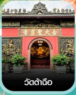
วัดต้าฉิว

✈️ คอนเฟิร์มออกเดินทาง ✈️ ทุกพีเรียด 2 ท่านขึ้นไป