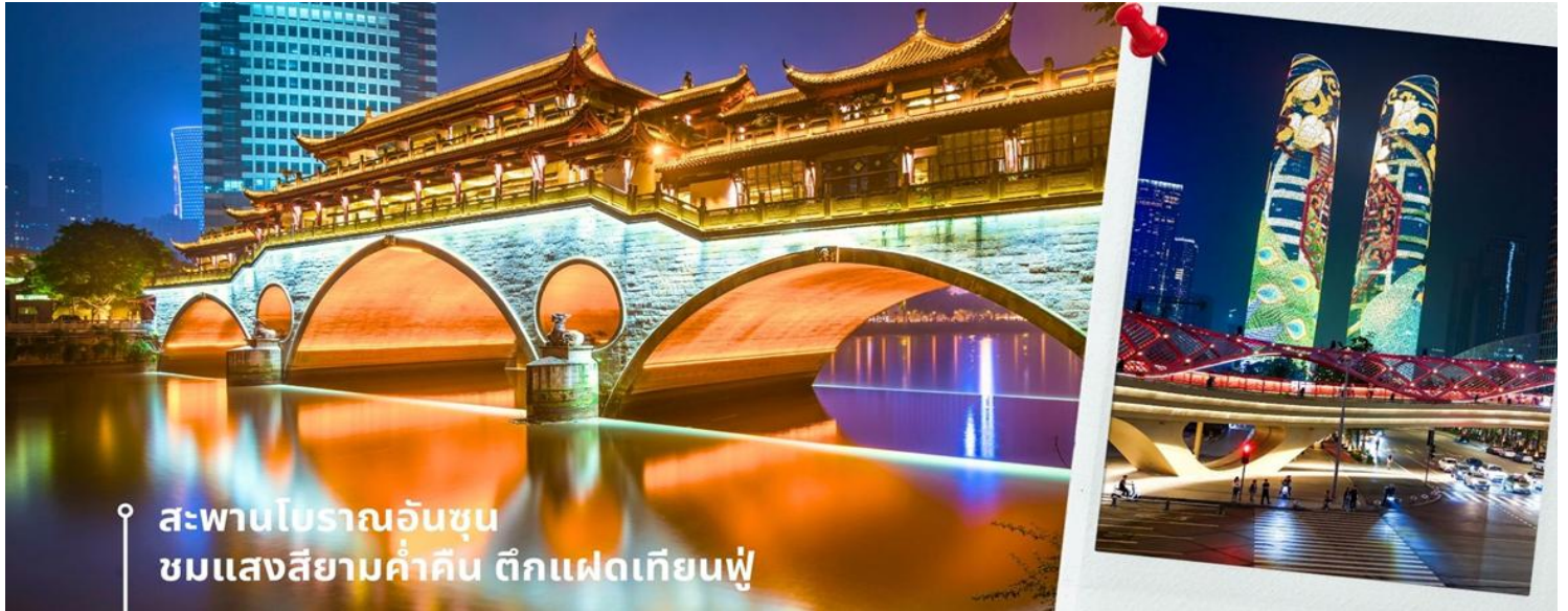
สะพานโบราณอันซุน ชมแสงสียามค่ำคืน ตึกแฝดเทียนฟู

นำท่านชม สะพานโบราณอันซุน-พร้อมชมแสงสียามค่ำคืน ตึกแฝดเทียนฟู เป็นสะพานข้ามคลองที่สร้างเป็นเหมือนอาคารอยู่ข้างบน ในช่วงเวลายามเย็นจะเป็นช่วงที่ผู้คนออกมาชมบรรยากาศบริเวณของสะพานแห่งนี้ และมีร้านค้ามากมาย รวมไปถึงบาร์เครื่องดื่มต่างๆ ที่ดึงดูดนักท่องเที่ยวได้เป็นอย่างดี เป็นสะพานที่ทอดข้ามแม่น้ำจินเจียง และเป็นรูปแบบสะพานมีหลังคา ตามลักษณะสถาปัตยกรรมจีนโบราณ อายุมากกว่า 300 ปี และในบริเวณใกล้เคียงยังเป็นที่ตั้งของ ตึกแฝดเทียนฟู โดยในช่วงค่ำเวลา ประมาณ 19.00-22.00 น. ทั้ง 2 ตึกจะเป็นไฟ LED สวยงามโดดเด่นมาก ตึกแฝดเทียนฟู หรือที่เรียกอย่างเป็นทางการว่าตึกศูนย์การเงินนานาชาติเทียนฟู เป็นตึกระฟ้าที่สวยงามโดดเด่นสองตึกในย่านการเงินของเฉิงตู ตึกแต่ละตึกมีความสูง 58 ชั้นและสูงกว่า 700 ฟุต ตึกเหล่านี้โดดเด่นเป็นพิเศษด้วยภายนอกที่หุ้มด้วยไฟ LED ที่เป็นเอกลักษณ์ ซึ่งเปลี่ยนอาคารให้กลายเป็นจอภาพดิจิทัลขนาดใหญ่