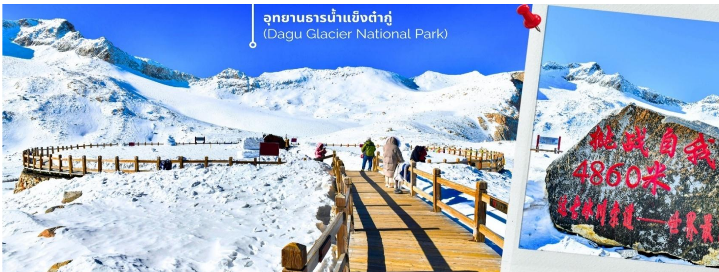
การตกและความหนาวของหิมะขึ้นอยู่กับสภาพอากาศ

จากนั้นนำท่านเดินทางสู่ เมืองเฮยสุ่ย (ใช้เวลาเดินทางประมาณ 2.5 ชั่วโมง) เพื่อเดินทางไปยัง อุทยานธารน้ำแข็งต้ากู่ปังชว่น (รวมกระเช้าขึ้นลง) ต้ากู่ปังชว่น หรือ Dagu Glacier National Park เป็นธารน้ำแข็งกลางเขี้ยวที่สวยงามที่สุดแห่งหนึ่งของโลก และเป็นสถานที่ท่องเที่ยวระดับ 4A ของจีน ตั้งอยู่ที่เมืองเฮยสุ่ย ในมณฑลเสฉวน ห่างจากเมืองเฉิงตูประมาณ 300 กิโลเมตร ถือเป็นธารน้ำแข็งที่อายุน้อยที่สุด ที่ตั้งอยู่ในระดับความสูงที่ต่ำที่สุด และอยู่ใกล้กับเมืองมากที่สุดในบรรดาธารน้ำแข็งทั้งหมด โดยอยู่สูงจากระดับน้ำทะเลประมาณ 3,800-5,100 เมตร จุดสูงที่สุดที่นักท่องเที่ยวสามารถขึ้นไปได้จะอยู่ที่ 4,860 เมตร