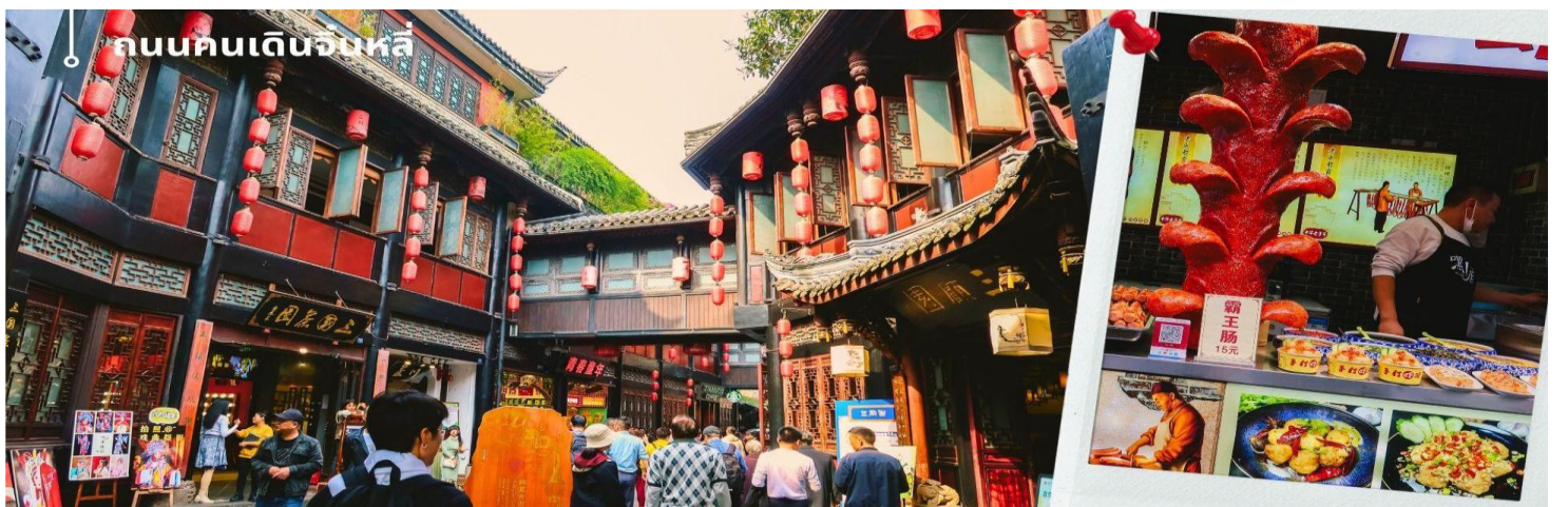
ถนนคนเดินจินหลี่

นำท่านเดินเล่น ถนนโบราณจินหลี่ เป็นหนึ่งในสถานที่ท่องเที่ยวที่น่าสนใจที่สุดสำหรับผู้ชื่นชอบประวัติศาสตร์และวัฒนธรรมจีน หมู่บ้านโบราณแห่งนี้มีความสำคัญอย่างยิ่งในเรื่องของประวัติศาสตร์ที่ยาวนานถึง 1,800 ปี ซึ่งเต็มไปด้วยวัฒนธรรมและขนบธรรมเนียมที่สะท้อนให้เห็นถึงวิถีชีวิตของคนจีนในยุคสมัยโบราณ จินหลี่เป็นหนึ่งในสถานที่ท่องเที่ยวที่นักท่องเที่ยวจากทั่วโลกให้ความสนใจอย่างมาก เนื่องจากการท่องเที่ยวที่นี่สามารถสัมผัสได้ถึงกลิ่นอายของประวัติศาสตร์ที่หลากหลาย