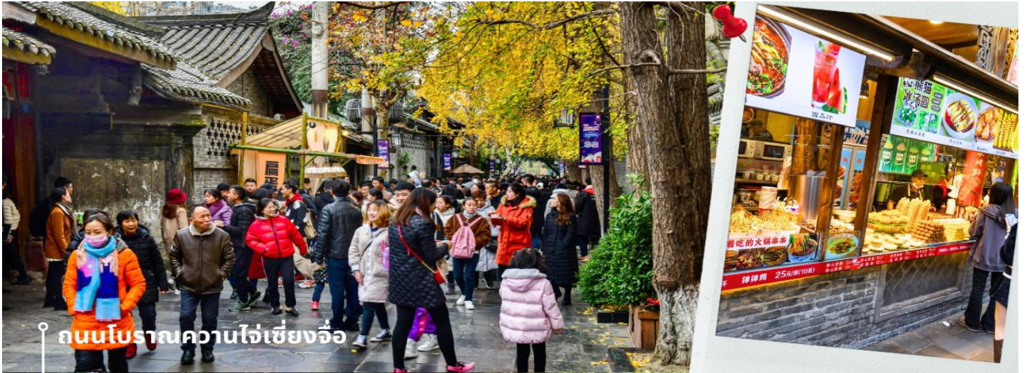
ถนนโบราณความใจเซียงจี้

หลังรับประทานอาหารเช้า นำท่านเดินทางสู่ ความใจเซียงจี้ หรือเรียกว่า ซอยกว้างซอยแคบ เป็นถนนที่ยังคงอนุรักษ์เสน่ห์ ความสวยงาม และ วิถี ชีวิตการเป็นอยู่ ของคนจีนชาวเฉิงตูในสมัยโบราณมาอย่างยาวนาน อีกทั้งยังผสมผสานกับยุคปัจจุบันเอาไว้ได้อย่างลงตัว ภายในบริเวณมีอยู่ 2 ซอย คือ ซอยกว้าง และ ซอยแคบ จึงเป็นที่มาของชื่อนี้ แต่ละซอยมีความยาวประมาณ 400 เมตร มีร้านค้าใหญ่เล็กเรียงรายตลอดซอย ทั้งร้าน ชา กาแฟ หนังสือ เสื้อผ้าชุดเซ็กซี่คอสเพลย์ ของวัยรุ่นเจ้าถิ่น เฉิงตู “ตงเจียว จี้” 东郊记忆 (Eastern suburb Memory) ที่มีทั้งแกลลอรี คาเฟ่ น่ารักๆ มากมาย และร้านเสื้อผ้า ร้านค้าเก่าๆ ให้เราได้เดินช้อปปิ้งเพลินๆ แลรมีจุดถ่ายรูป ตลอดทั้งถนน และร้านอาหาร