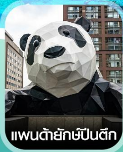
แพนด้ายักษ์ปิ่นตึก