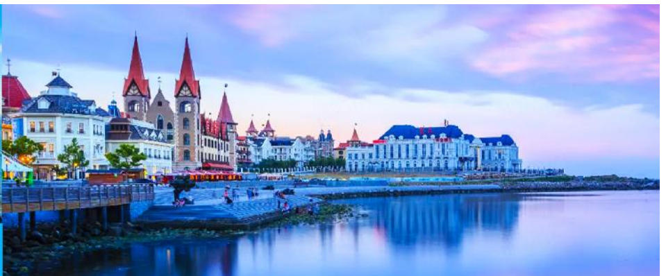
ท่าเรือชาวประมงไห่ซาง