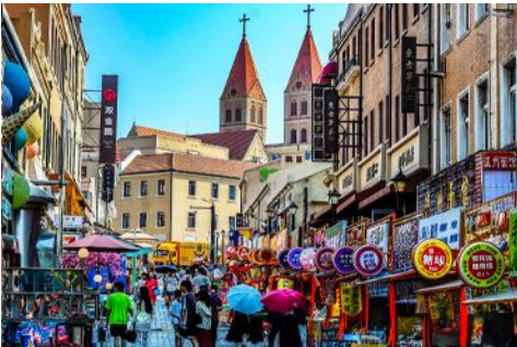
ถนนจงซาน