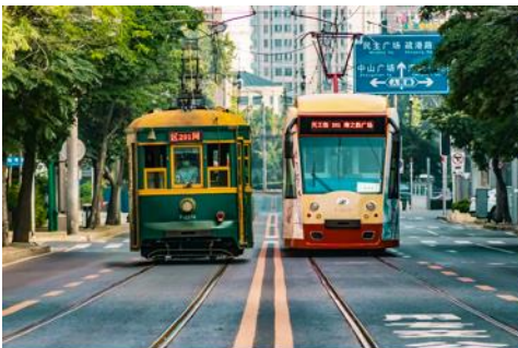
รถรางไฟฟ้า