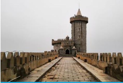
คาเฟ่อีสดง