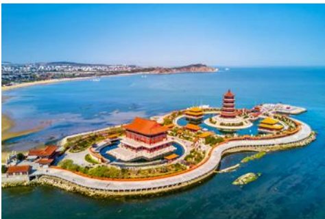
อุทยานท่องเที่ยวแปดเซียนข้ามทะเล