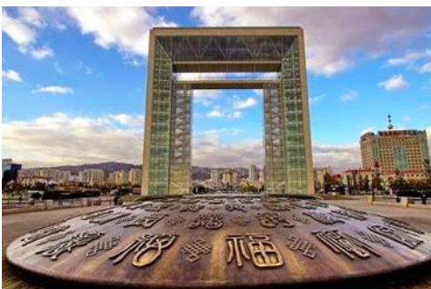
ประตูแห่งโชคกลาง