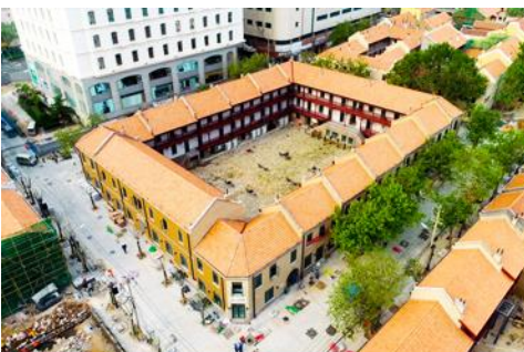
เมืองเก่าเยอรมัน ตรอกกว่างซิงหลี่