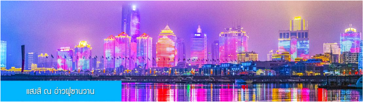
แสงสี ณ อ่าวฟู่ซานวาน

หลังอาหารนำท่านชมความอลังการของแสงสี ณ อ่าวฟู่ซานวาน 浮山湾灯光秀 ชมความอลังการของแสงสียามหัวค่ำ และไฟที่เด่นระบำได้บนตึกสูง และเป็นหนึ่งในไนท์วิวที่สวยงามที่สุดแห่งหนึ่งของจีน..... พักที่ JIFENG HOTEL / KAILAIZHIHUI HOTEL โรงแรมระดับ 4 ดาวท้องถิ่น เมืองชิงเต่า