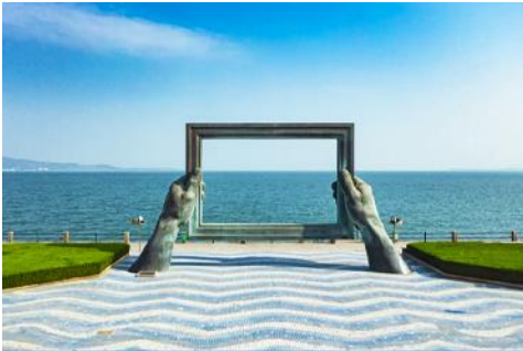
กรอบรูปวิวทะเล