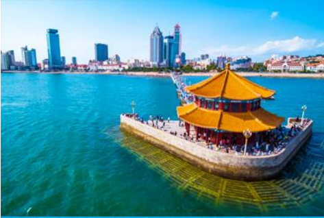
สะพานจ้านเจียว