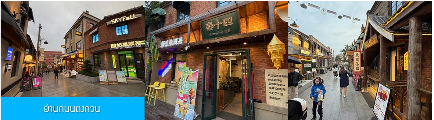
ย่านถนนตวงกวน

หลังอาหารนำท่านเที่ยวชม จัตุรัสชิงไห่ 星海广场 เป็นจัตุรัสขนาดใหญ่เป็นแลนด์มาร์คสำคัญของเมืองต้าเหลียน สร้างขึ้นเพื่อเฉลิมฉลองในโอกาสที่รัฐบาลอังกฤษคืนเกาะฮ่องกงในให้จีนในปี ค.ศ. 1997 ตั้งอยู่ชายฝั่งทะเลในเมืองต้าเหลียน เป็นจัตุรัสใจกลางเมืองที่ใหญ่ที่สุดในโลกและ เป็นแลนด์มาร์คของเมืองต้าเหลียน รายล้อมด้วยตึกระฟ้าที่ทันสมัย ภายในมีบ่อน้ำพุดนตรี ลานหญ้าขนาดใหญ่ และลานกว้างสำหรับจัดกิจกรรมกลางแจ้ง อาทิ เทศกาลเบียร์นานาชาติ การแข่งขันวิ่งมาราธอน งานแฟชั่นนานาชาติเมืองต้าเหลียน ฯลฯ