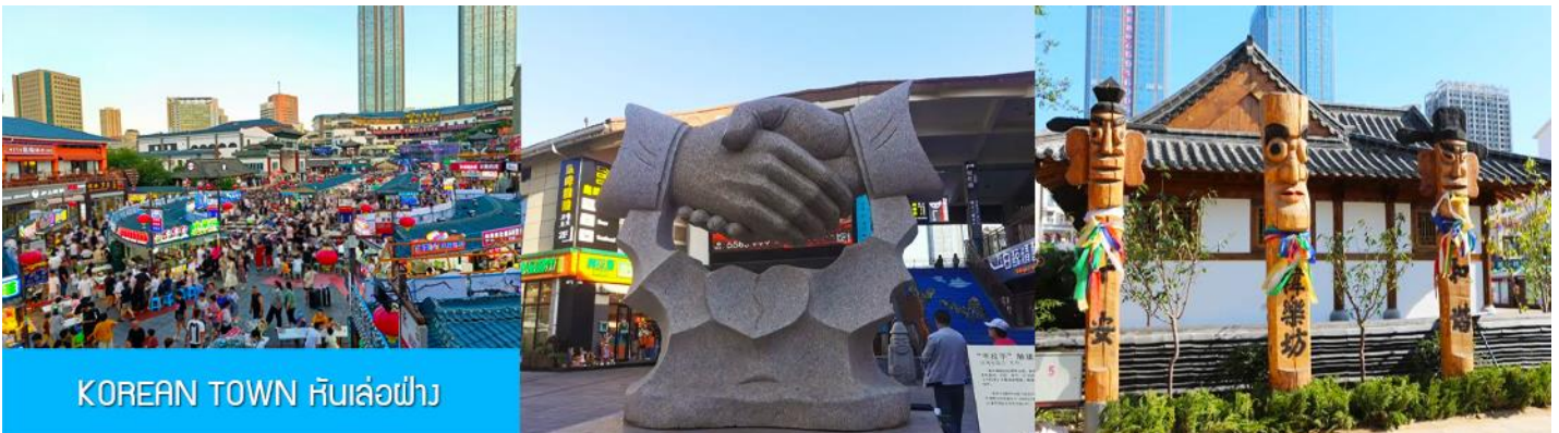
KOREAN TOWN หันเล่อฝาง