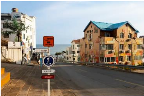
ถนนคบเพลิงหมายเลข 8

นำท่านชมสวนสาธารณะเวย์ไห่ 威海公园 สวนสาธารณะริมทะเลที่ใหญ่ที่สุดของเมืองเวย์ไห่ ให้ท่านชมและถ่ายภาพคู่กับ กรอบรูปยักษ์วิวทะเล 威海公园大相框 แลนด์มาร์คที่เป็นอีกหนึ่งไฮท์ไลท์ฮิตของเมืองเวย์ไห่