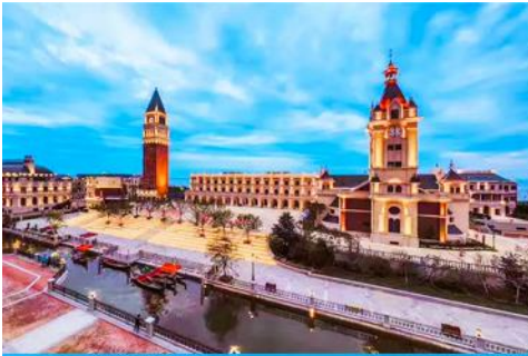
เมืองเวนิสตะวันออก