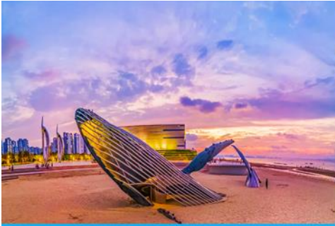
ประติมากรรม วาฬโดดเดี่ยว

หลังอาหารนำท่านเที่ยวชม ท่าเรือชาวประมงไห่ซาง 烟台海昌鱼人码头 ทำเรื่อนี้เต็มไปด้วยสถาปัตยกรรมสไตล์อเมริกาเหนือ และยุโรป ให้ท่านได้สัมผัสและเก็บภาพบรรยากาศที่แสนโรแมนติกริมทะเล ที่มีอาคาร