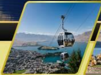
นั่งกระเช้าคอนโดล่า