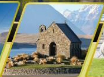
ทะเลสาบเทคาโป