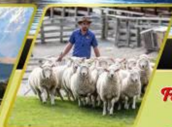
วอลเตอร์ฟิคฟาร์ม