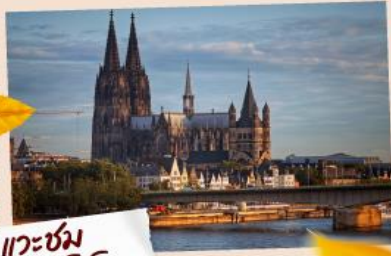
แควซม มหาวิหารโคโลญ