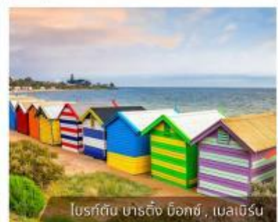
โบสถ์สีรุ้ง บาร์คิง บ็อกซ์, เมลเบิร์น