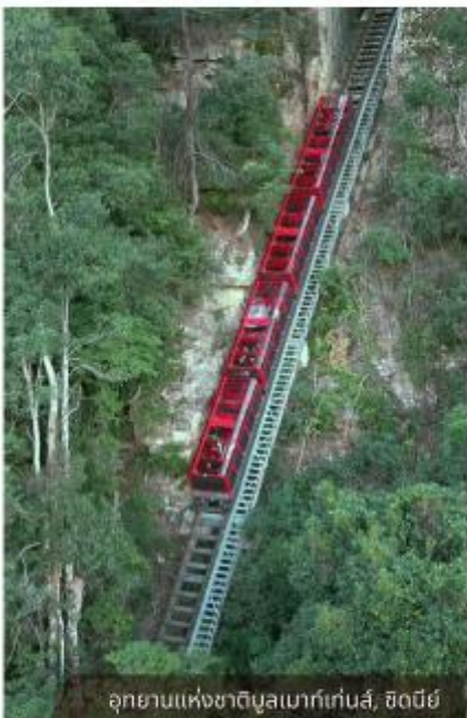
อุทยานแห่งชาติบลูเมาท์เทนส์, ซิดนีย์