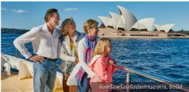
ล่องเรือพร้อมรับประทานอาหาร, ซิดนีย์