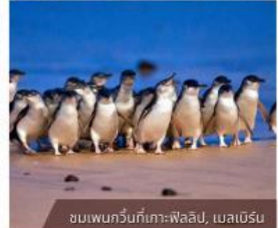
ชมเพนกวินที่เกาะฟาลิป, เมลเบิร์น