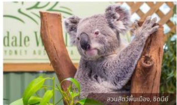
สวนสัตว์พื้นเมือง, ซิดนีย์