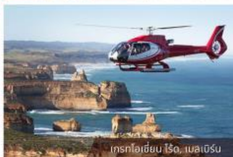
เกรทโอเชียน ไรด์, เมลเบิร์น