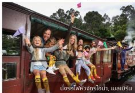
มิ่งรถไฟหิวจักรไอน้ำ, เมลเบิร์น