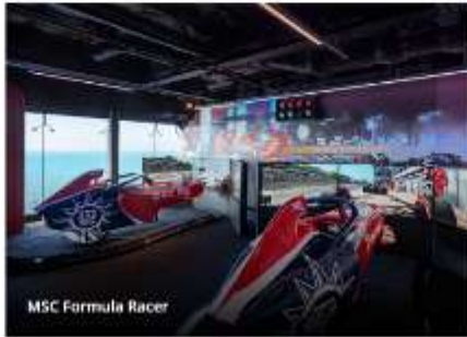
MSC Formula Racer