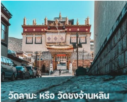
วัดลามะ หรือ วัดชงจ้านหลิน