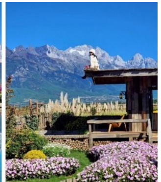
คาเฟ่สุดฮิต COFFEE YUN DI AN

จากนั้นนำท่านเดินทางสู่ สระมังกรดำ ชมความงดงามของอุทยานที่กว้างใหญ่ และน้ำในบึงที่ใสสะอาดมาก จนสามารถสะท้อนภาพทิวทัศน์ของภูเขาหิมะให้เห็นได้อย่างชัดเจน