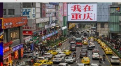
กวนอิมเฉียว