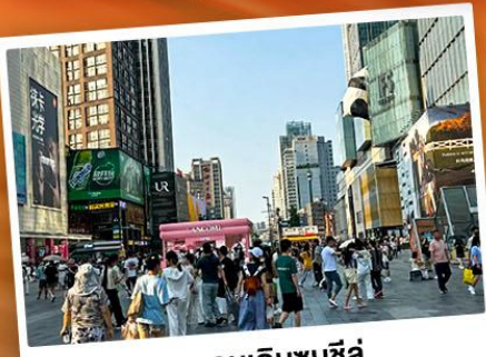
ถนนคนเดินชุนซี้

"สวีทเซอร์แคนด์เนอช" แคนมังกร แหล่งท่องเที่ยวทางธรรมชาติระดับ 4A