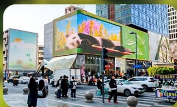
ไท่กู่หลี่