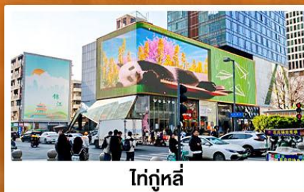
ไถ่กุหลี่