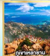
ภูเขาเหลาซาน