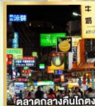
ตลาดกลางคืนโกตง