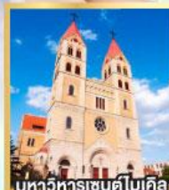
มหาวิหารเซนต์ไมเคิล