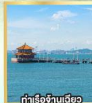
ท่าเรือจันทิว