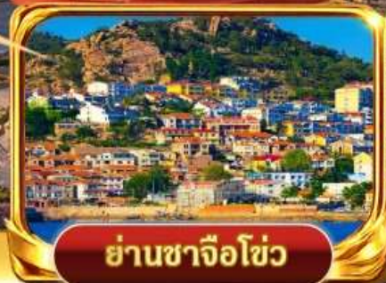
ย่านชาจื่อซิว