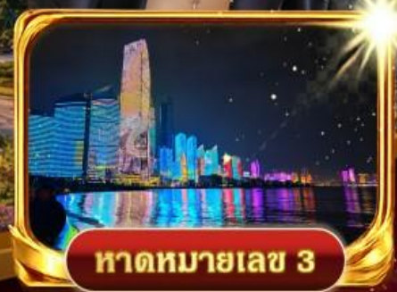
หาดหมายเลข 3