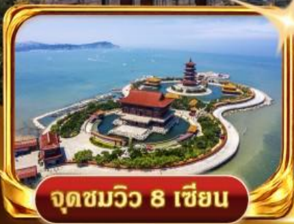
จุดชมวิว 8 เชียง