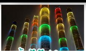
น้ำพุไม้ไฟตึกSKP