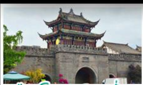
เมืองโบราณทวนเซี่ยน

ภูเขาสี่ฤดู - อุทยานปู้ผิงโกว - สะพานหนานเฉียว - ร้านหนังสือจงซูเก้อ - เมืองโบราณกวนเหลียน จตุรัสหยางเทียนหวู่ - หิมะแพนด้าเซลฟ์ - ถนนโบราณชอยกวงซงฮวยแคบ - ถนนคนเดินไท่กู่หลี่ ถนนคนเดินซุชชี - ถนนโบราณจินหลี่ - แพนด้ายักษ์ปีนตึก - บ้านฟูไบ่ไฟตึกSKP - วัดต้าเจ้อ