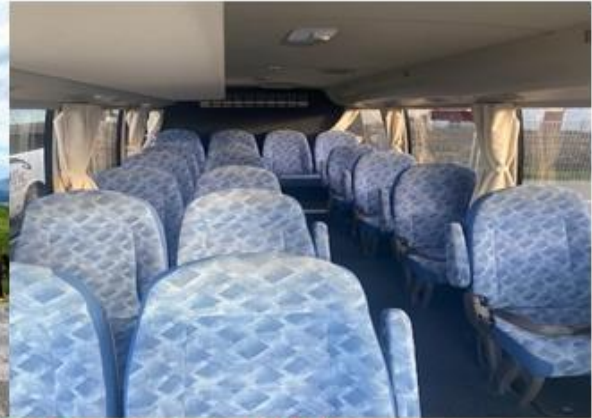
* ลुकค้าจำนวน 10 - 14 ท่าน ใช้รถบัสขนาด 19 - 21 ที่นั่ง*