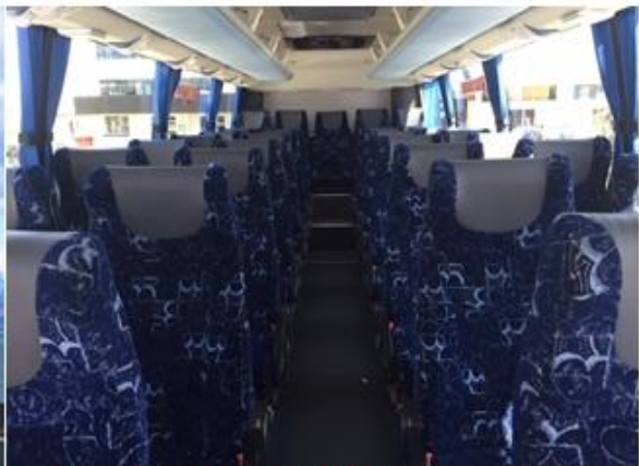
* ลุกค้าจำนวน 15 ท่านขึ้นไป ใช้รถบัสขนาด 30 - 35 ที่นั่ง*