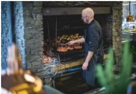
รับประทานอาหารกลางวัน บาร์บีคิว ณ วอลเตอร์พีคฟาร์ม