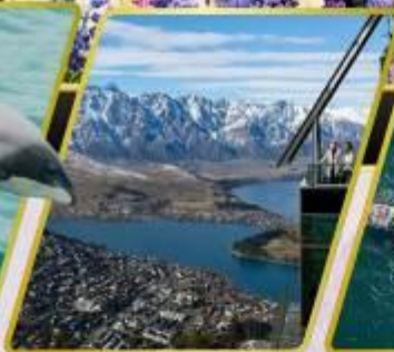
ยอดเขานีออนส์พีค