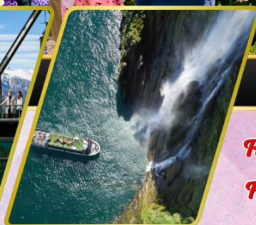
ล่องเรือมิลฟอร์ด ซาวัน