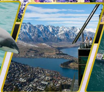
ยอดเขานีออนส์พีค