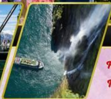
ล่องเรือมิลฟอร์ด ซาวน์