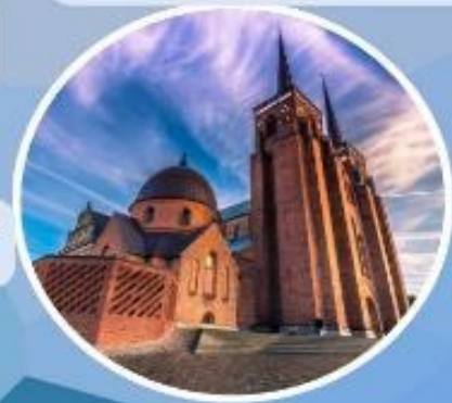
เข้าชม “มหาวิหารรอสโคลด์”