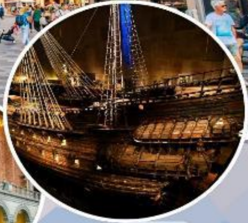
เข้าชม “พิพิธภัณฑ์เรือวาซา”