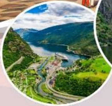
นั้งรดไฟสายโรแมนติก “Flamsbana”