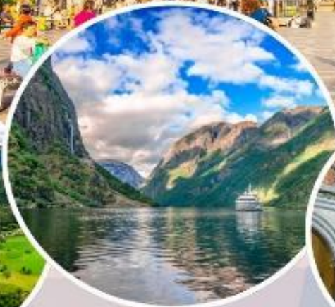
ล่องเรือ “Nærøyfjord”