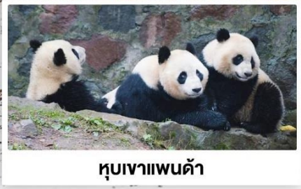
หุบเขาแพนด้า