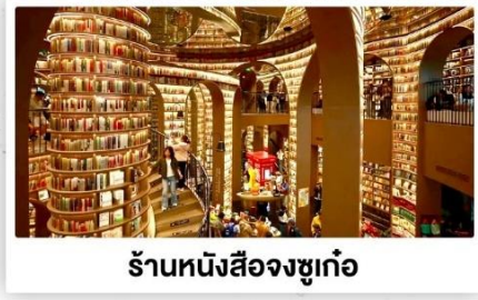
ร้านหนังสือจงซูเก๋อ

เดินทางโดย: สายการบินเจิงตูแอร์ไลน์ (EU)