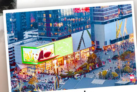
ถนนไท่กู่หลี่หลิน