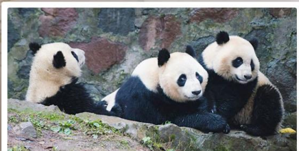
หุบเขาแพนด้า