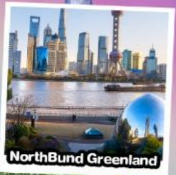
North Bund Greenland