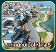
ทะเลสาบเอ๋อไห่คิง S