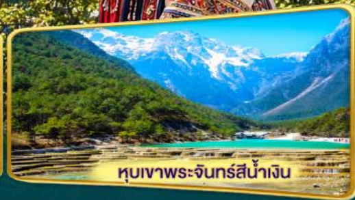
หมู่บ้านพระ-จันทรสีน้ำเงิน