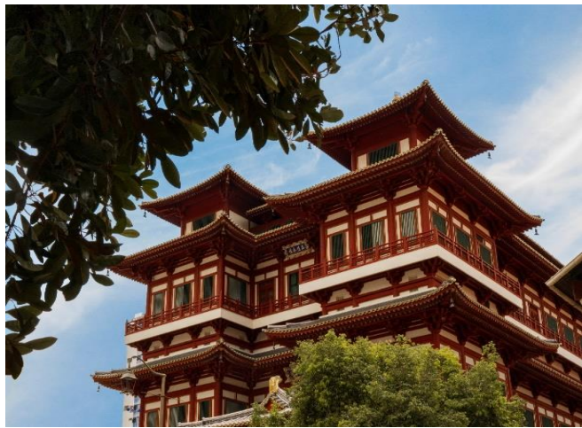
ประมาณ 1 ชม.

นำท่านเดินทางสู่ CHINATOWN ชมวัดพระเขี้ยวแก้ว (Buddha Tooth Relic Temple) สร้างขึ้นเพื่อเป็นที่ประดิษฐานพระเขี้ยวแก้ว ของพระพุทธเจ้า วัดพระพุทธศาสนาแห่งนี้สร้างสถาปัตยกรรม สมัยราชวงศ์ถัง วางศิลาฤกษ์ เมื่อวันที่ 1 มีนาคม 2005 ค่าใช้จ่ายในการก่อสร้างทั้งหมดราว 62 ล้านดอลลาร์สิงคโปร์ (ประมาณ 1500 ล้านบาท) ชั้นล่างเป็นห้องโถงใหญ่ใช้ประกอบศาสนพิธี ชั้น 2-3 เป็นพิพิธภัณฑ์และห้องหนังสือ ชั้น 4 เป็นที่ประดิษฐานพระเขี้ยวแก้ว (ห้ามถ่ายภาพ) ให้ท่านได้สักการะองค์เจ้าแม่กวนอิม และใกล้กันก็เป็นวัดแขกซึ่งมีศิลปกรรมตกแต่งที่สวยงาม พร้อมเดินเล่นช้อปปิ้ง ชื่อของที่ระลึกตามอัธยาศัย