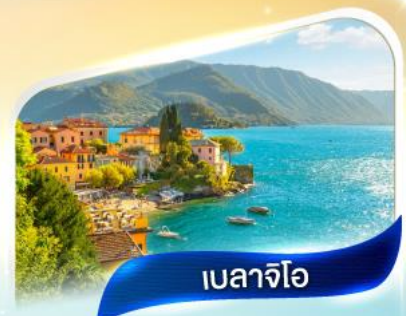
เบลลาจีโอ