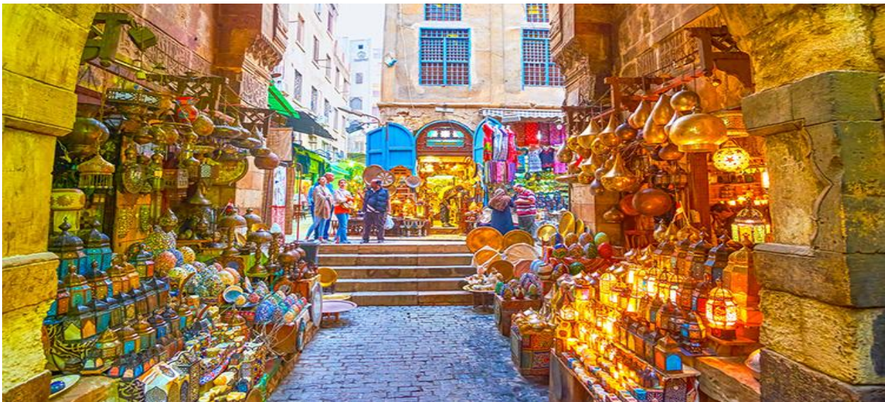
คำ บริหารอาหารเย็น ณ ภัตตาคารท้องถิ่น (อาหารไทย) นำท่านออกเดินทางสู่สนามบินไคโร

จากนั้นนำท่านเดินทางสู่ ตลาดข่านเอลคาลิลี (KHAN EL KHALILI) ตลาดข่าน เอล คาลิลี (Khan El Khalili Bazaar) ประเทศอียิปต์ เป็นตลาดสไตล์อาหรับโบราณ อายุกว่า 600 ปี ถูกสร้างขึ้นครั้งแรกในช่วงปลายศตวรรษที่ 14 (ค.ศ. 1382-1389) โดย Jaharkas al-Khalili เดิมทีพื้นที่ตรงนี้เป็นสุสานของราชวงศ์ฟาติมิด ต่อมาได้มีการเคลื่อนย้ายกระดูกและสร้างอาคารพาณิชย์ขึ้น ตลาดขายของพื้นเมืองและสินค้าที่ระลึกที่ใหญ่ที่สุดในกรุง ไคโร ท่านสามารถเลือกซื้อของพื้นเมืองสวยๆ มากมาย ไม่ว่าจะเป็นขวดน้ำหอมที่ทำด้วยมือ สินค้าต่างๆ เครื่องทองรูปพรรณ และเพชรพลอย ลวดลายแบบอาหรับ พรหม และของที่ระลึกพื้นเมืองต่างๆ