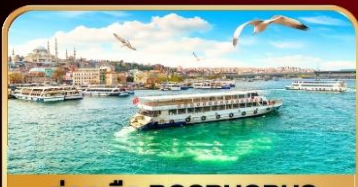
ล่องเรือ BOSPHORUS