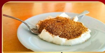
โยเกิร์ตปั่น