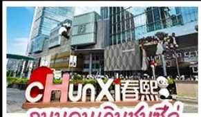
ถนนคนเดินชุนซีอู๋