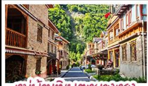
หมู่บ้านทิเบตเซียงตรง

ตะลุยเจ็ดตุ๋น ต้ากู่ปิงชาน ชมเขื่อนจินเพนต้าอี้กัซ พักใจที่หยดน้ำตาสีฟ้า! แวงซือเมืองโบราณลั่วไต สัมผัสสมมติสมันท์ หมู่บ้านทิเบตหยางหงฮาเค้อ สัมผัสความหนาวเย็นที่ อุทยานสวรรค์ธารน้ำแข็งต้ากู่ปิงชาน แหล่งรวมวิวหลักล้าน ตื่นตาไปกับแสงสียามค่ำคืน หยดน้ำตาสีฟ้า ละ สพานหนานเฉียว เมืองตุ๋นเจียงเยี่ยน ก่อนปิดท้ายด้วยการช้อปปิ้งจุใจ ถนนชุนซีอู๋-ไถ่กู่หลี่ และทะเลสาบกับ แพนด้าซาฟารี สุดคิวท์