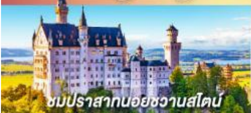
ชมปราสาทนอยชวานสไตน์