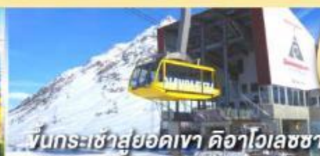
ขึ้นกระเช้าสู่ออดเขา ดิอาโวลอสซา