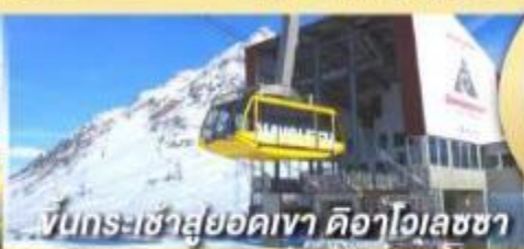
ขึ้นกระเช้าสู่ยอดเขา ดือาโฮเลซซา