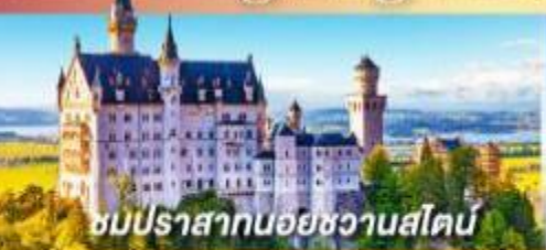
ชมปราสาทนอยชวานสไตน์