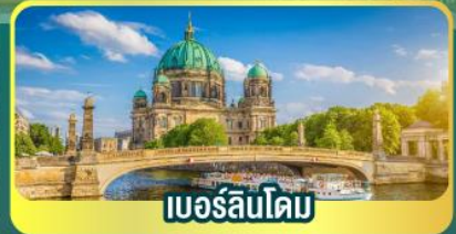
เบอร์ลินโดม