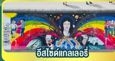
อิสเซ็คเทลเลอร์