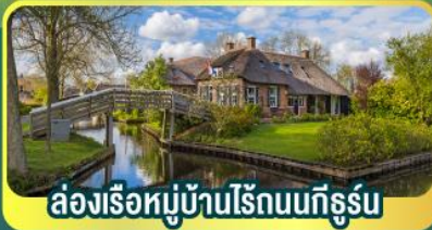
ล่องเรือหมู่บ้านไร้ถนนทีร์ูม