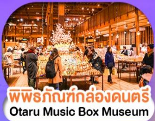
พิพิธภัณฑ์กล่องดนตรี Otaru Music Box Museum