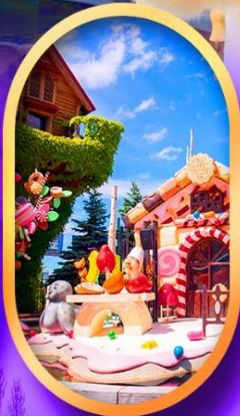
โรงงานช็อกโกแลต