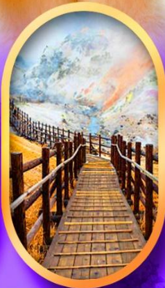
หุบเขานรกจิงคุดานิ