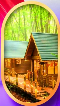
นิงเกิลเกอเรส