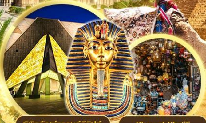
พิพิธภัณฑ์แกรนด์อียิปต์