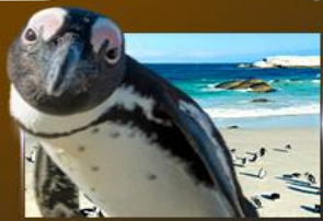
Simon's Town ชมฝูงเพนกวิน