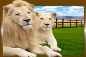
The Lion Park