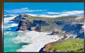
cape of good hope