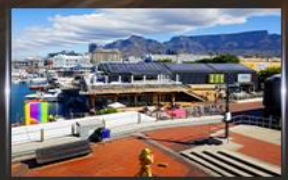
ท่าเรือ V&A waterfront