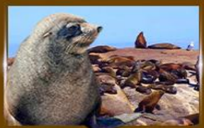
ส่องเรือชมฝูงแมวน้ำ Seal Island