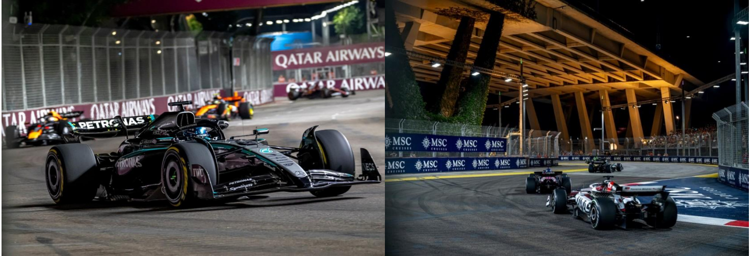
ชม รอบ RACEDAY + MAIN RACE

**เดินทางด้วยตนเอง เข้าร่วมงาน FORMULA 1 SINGAPORE GRAND PRIX 2026**