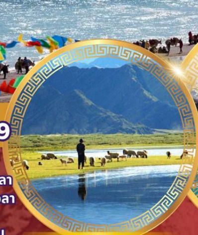
ทุ่งหญ้าทีเบตเหนือ ชางเปย์

ลานา พระราชวังโปตาลา วัดโจคัง ถนนแปดเหลี่ยม จุดชมวิวย่องเขากัมบาลา ธารน้ำแข็งคาโรลา ซิกาชะ ช่องเขาจาชั่วลา ถนน108โค้ง เอเวอเรสต์เบสแคมป์ วัดทาชิลูโบ ทิวทัศน์แม่น้ำหยาสู่อ่างปู ทุ่งหญ้าทีเบตเหนือ ช่องเขานาเคนลา ทะเลสาบนามูซู่