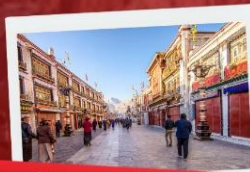
ช้อปปิ้ง ถนนแปดเหลี่ยม