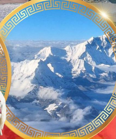
ห้าสุดยอดแห่งหิมาลัย