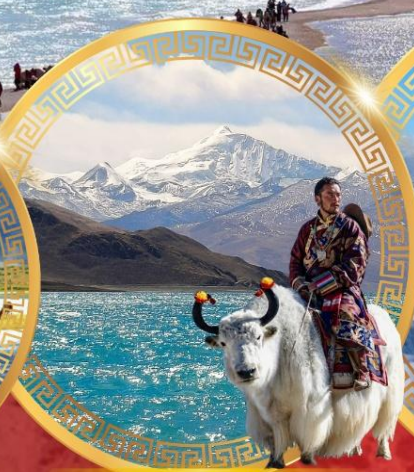
ทะเลสาบยิมตริอ็อก