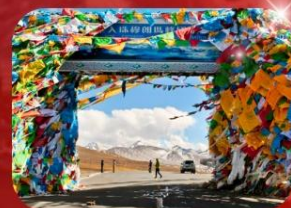
ทางเข้าสู่ดินแดนเอเวอเรสต์