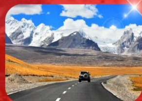
ถนนสายมิตรภาพจีน-เนปาล

พักโรงแรม 4 ดาว ★★★★★ ฟรี บริการอาหารท้องถิ่น