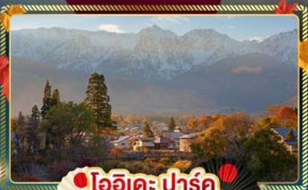
โออิชิปาร์ค