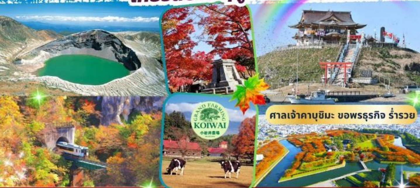
ศาลเจ้าคาบุชิมะ ขอพรรธธุรกิจ ร้ารวย

เที่ยว 2 เกาะ!! ชมใบไม้เปลี่ยนสี เที่ยวสบาย ฤดู้อลใจ ซ้อปปีงครบ