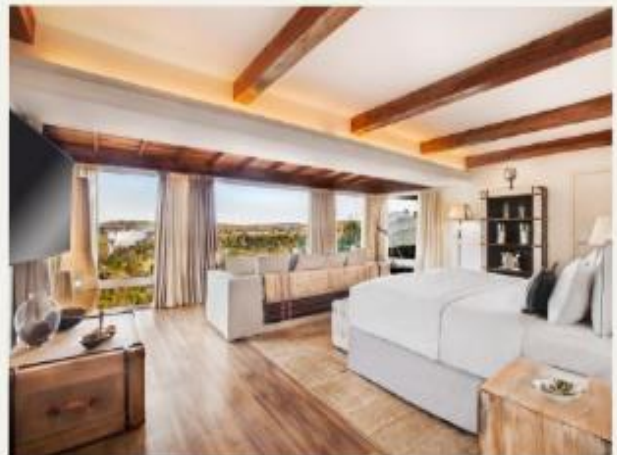
Hotel das Cataratas, A Belmond Hotel