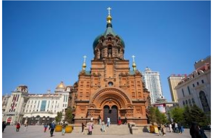
หยวน/ท่าน)

นำท่านเดินทางสู่ โบสถ์เซนต์โซเฟีย(Saint Sophia Cathedral) แลนด์มาร์กสำคัญของเมืองฮาร์บิน โบสถ์คริสต์นิกายออร์ทอดอกซ์ที่มีสถาปัตยกรรมแบบรัสเซียอันโดดเด่น ด้วยโดมสีเขียวขนาดใหญ่และผนังอิฐสีแดง สวยงามคลาสสิก ให้ท่านถ่ายรูปตามอัธยาศัย (ถ่ายรูปด้านนอกไม่รวมค่าเข้าประมาณ 15