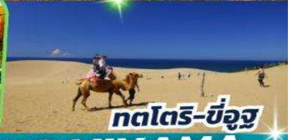
ทตโตริ-ซึงู