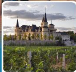
ไร่ไวน์ จุนยี่ เยียนโก