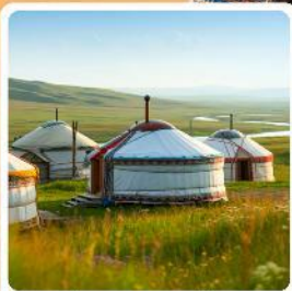
ที่พักแบบกระโจม