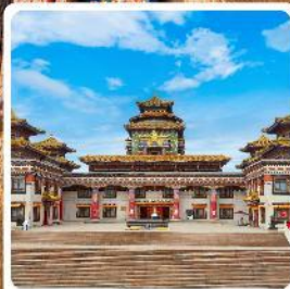
ทำเนียบพระลามะอูหลาน