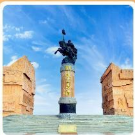
เขตท่องเที่ยวเจงกีสข่าน