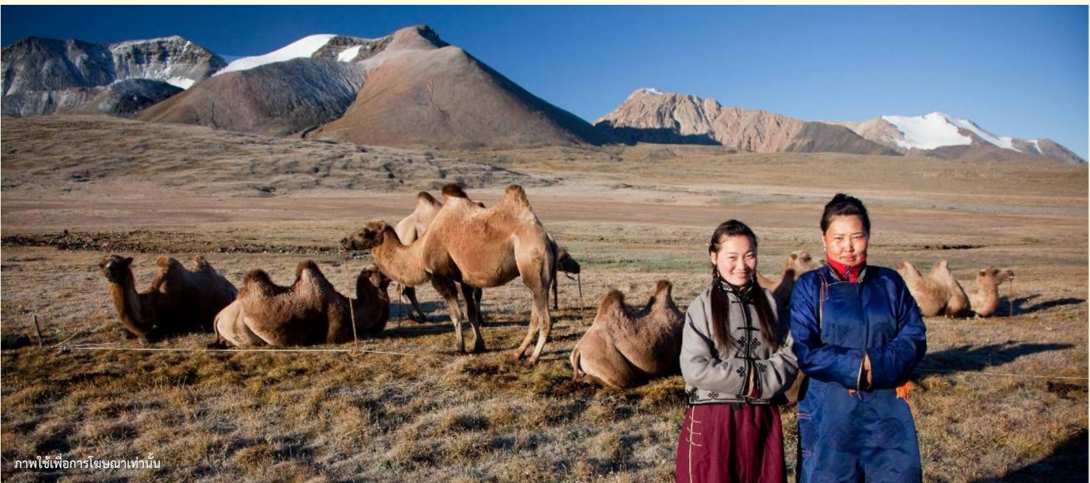
ภาพใช้เพื่อการโฆษณาเท่านั้น

นำท่านร่วมกิจกรรม พิธีต้อนรับแขกสไตล์มองโกล เป็นประเพณีโบราณที่มีมาช้านาน ชาวมองโกลมีอุปนิสัยที่รักเพื่อนฝูงและตรงไปตรงมาไม่เสแสร้ง เมื่อมีเพื่อนหรือแขกมาเยือนก็มักจะผูกมิตรอย่างจริงจัง และนำท่านร่วมกิจกรรม สวมใส่ชุดมองโกล สัมผัสพลังแห่งบรรพบุรุษ สวมเสื้อคลุมแบบดั้งเดิมที่มีสีสันสดใส ปักลวดลายอันประณีต คุณจะสัมผัสได้ถึงพลังแห่งบรรพบุรุษที่เคยปกครองดินแดนครึ่งโลก การสวมหมวกขนสัตว์ ผูกสายรัดเอว พร้อมเครื่องประดับเงินแท้ที่ส่องแสงระยิบระยับ จะทำให้ท่านเสมือนกลายเป็นนักรบแห่งทุ่งหญ้า พร้อมเครื่องประดับเงินแท้ที่ส่องแสงระยิบระยับ ของชนเผ่าที่เคยปกครองดินแดนครึ่งโลก เมื่อคุณยืนท่ามกลางทุ่งหญ้าไร้ขอบเขต