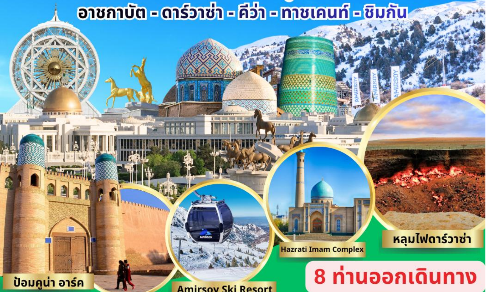
ป้อมคูน่า อาร์ค

อาชกาบัต - ดาร์วาซ่า - คีว่า - ทาชเคนท์ - ซิมกัน