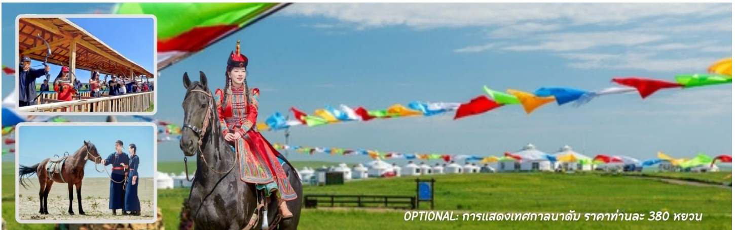
OPTIONAL: การแสดงเทศกาลนาดั้ม ราคาท่านละ 380 หยวน

หมายเหตุ : บางกิจกรรมอาจมีการเปลี่ยนแปลงโดยไม่ได้แจ้งให้ทราบล่วงหน้า ทั้งนี้ขึ้นอยู่กับสภาพภูมิอากาศในแต่ละปี ปรกวนสอบถามกับทางไกด์ท้องถิ่น หรือหัวหน้าทัวร์ให้ละเอียดก่อนการตัดสินใจซื้อ