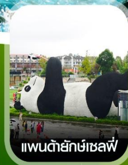
แพนด้ายักษ์เซลฟี่

✈️ คอนเฟิร์ม ออกเดินทาง ทุกพีเรียด 2 ท่านขึ้นไป