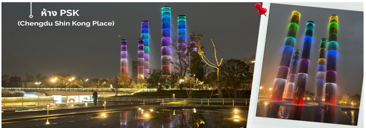
ห้าง PSK (Chengdu Shin Kong Place)

นำท่านเดินทางสู่ Global Center แลนด์มาร์กยักษ์ของเมืองเฉิงตูที่ขึ้นชื่อว่าเป็นหนึ่งในอาคารที่มีขนาดใหญ่ที่สุดในโลก ภายใน ศูนย์การค้าแห่งนี้ครบครันทั้งช้อปปิ้งแบรนด์ดัง โรงแรม ศูนย์ประชุม โรงภาพยนตร์ อีกหนึ่งจุดไฮไลท์ที่ไม่ควรพลาดเมื่อมาเยือนศูนย์การค้า Global Center คือ น้ำพุไม้ไฟ การออกแบบสุดสร้างสรรค์ที่ผสมผสาน ความงดงามของธรรมชาติกับศิลปะสมัยใหม่ น้ำพุแห่งนี้สร้างขึ้นในรูปทรง “กอไม้” อันเป็นสัญลักษณ์ของความสงบและความ รุ่งเรืองของชาวเสฉวน เมื่อเปิดการแสดง น้ำจะพุ่งขึ้นสู่ท้องฟ้าพร้อมแสงไฟหลากสี สร้างบรรยากาศตระการตา และโรแมนติก เหมาะสำหรับการถ่ายรูปและพักผ่อนหย่อนใจหลังจากการช้อปปิ้งในศูนย์การค้าอันยิ่งใหญ่แห่งนี้ ปิดท้ายด้วยการชมไฟ ตึกแฝดเฉิงตูสัญลักษณ์แห่งความทันสมัยของเมืองเฉิงตู ตั้งอยู่ย่านศูนย์กลางการเงิน Tianfu New Area ตึก แฝดสูงเสียดฟ้านี้เป็นที่ทำงานของบริษัทชั้นนำและศูนย์การประชุมขนาดใหญ่ ยามค่ำคืนบริเวณนี้จะ