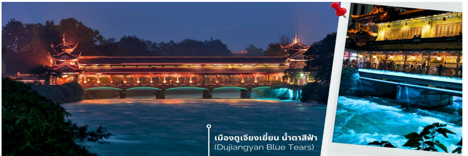
เมืองตูเจียงเยียน น้ำตาสีฟ้า (Dujiangyan Blue Tears)

นำท่านเดินทางสู่ เมืองโบราณตูเจียงเยียน เมืองนี้เป็นแหล่งโครงการชลประทานต้นแบบสมัยโบราณที่มีประวัติยาวนานมากกว่า 2,274 ปี ตั้งอยู่ในมณฑลเสฉวน เพื่อแก้ปัญหาน้ำท่วมในพื้นที่ลุ่มแม่น้ำ Minjiang และเพื่อจัดสรรน้ำสำหรับการเกษตรนี้ โดยการสร้างควบคุมน้ำที่ไม่ต้องพึ่งพาเขื่อนชลประทานนี้ยังคงใช้งานได้ดีจนถึงปัจจุบันและได้รับการยกย่องให้เป็นหนึ่งในมรดกโลกโดยองค์การยูเนสโก และยังเป็นต้นแบบของภูมิปัญญาด้านการจัดการทรัพยากรน้ำของจีน ไม่เพียงแต่ได้รับการ ยกย่องในด้านวิศวกรรมอันชาญฉลาดและประโยชน์ต่อระบบนิเวศเท่านั้นแต่ยังเป็นที่รู้จักในฐานะสถานที่ชมความงามของปรากฏการณ์ “น้ำตาสีฟ้า” ที่ตราตรึงใจนักท่องเที่ยวทั่วโลก ให้ท่านเข้าชมธารน้ำสีฟ้า Blue Tears เป็นจุดท่องเที่ยวที่เต็มไปด้วยมนต์เสน่ห์แห่งสถาปัตยกรรมจีนแบบดั้งเดิม ทอดยาวข้ามแม่น้ำ กลายเป็นภาพอันน่าประทับใจยามค่ำคืนเมื่อแสงไฟตกแต่งส่องสะท้อนน้ำให้กลายเป็นสีฟ้าเงิน ดูสวยงามราวกับโลกแห่งจินตนาการ ความพิเศษอยู่ที่การจัดไฟอย่างประณีต ซึ่งช่วยเน้นให้สะพานมีชีวิตชีวาท่ามกลางบรรยากาศยามค่ำคืนที่รายรอบไปด้วยภูเขาและต้นไม้เพิ่มความรู้สึกสงบและสดชื่น เมื่อเดินข้ามสะพานนี้แล้วได้สัมผัส