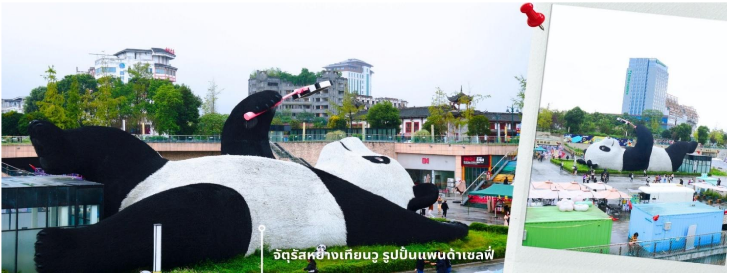
จัตุรัสหย่างเทียนวู รูปปั้นแพนด้าเซลฟี่

เมตร กว้าง 11 เมตร สูง 12 เมตร และหนัก 130 ตัน แบบท่าทางสบายๆของแพนด้าที่ความประทับใจและรอยยิ้มให้กับผู้ที่มาเยือนจัตุรัสหย่างเทียนวู สามารถดึงดูดนักท่องเที่ยวได้เป็นจำนวนมากเลยทีเดียว เป็นการแสดงออกด้วยภาษาทางศิลปะแบบหนึ่งที่สะท้อนชีวิตในท้องถิ่น มอบความรู้สึกสนิทสนมและมีความสุขกับผู้ชมอิสระเดินชมถ่ายภาพ รูปปั้นแพนด้าเซลฟี่ ตามอัครยาศัย ที่นึ่งเป็นจุดเช็คอินที่เหมาะสมสำหรับทุกเพศทุกวัย หากคุณ