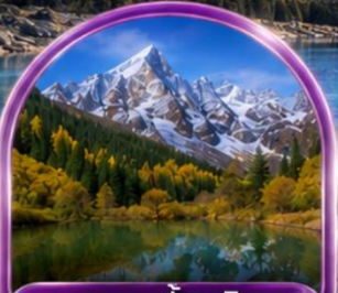
อุทยานปี้ผิงโกว (รวมรถกอล์ฟ)