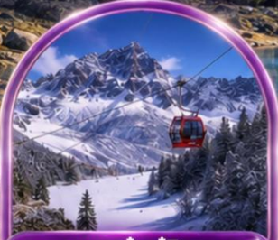
อุทยานคำกู่ปิงชเวน (รวมรถอุทยาน+กระเช้า)

พิเศษ สุกี้หม่าล่า !! พร้อมน้ำจิ้มรสเด็ด