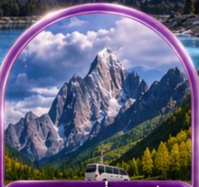
อุทยานสีดรุณี (รวมรถอุทยาน)